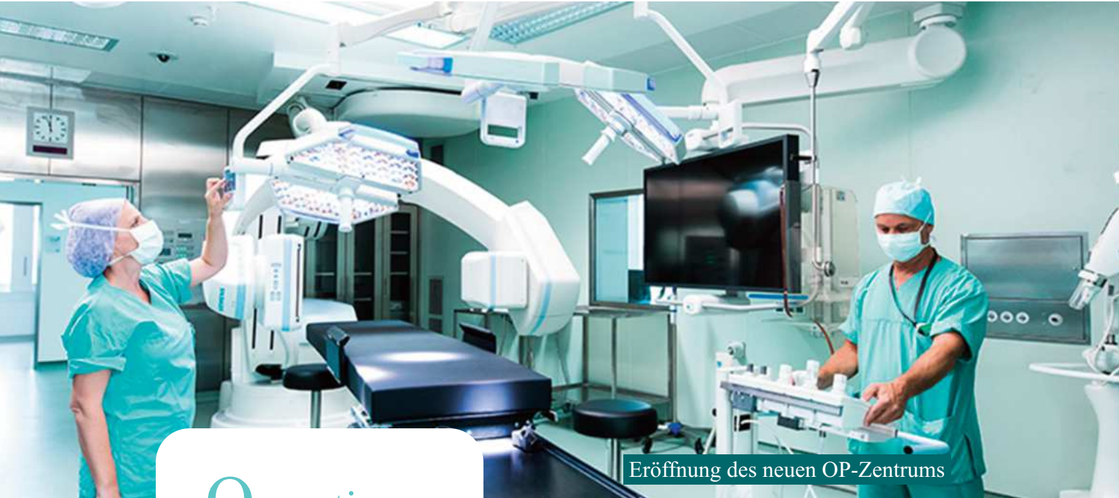
Eröffnung des neuen OP-Zentrums